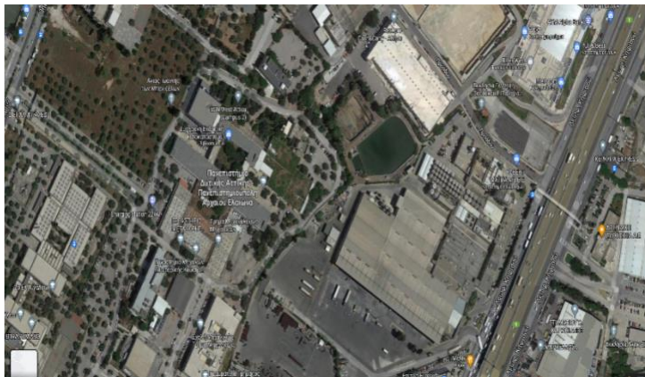
Πανεπιστημιούπολη, «Αρχαίου Ελαιώνα», Π. Ράλλη & Θηβών 250, 12241 Αιγάλεω