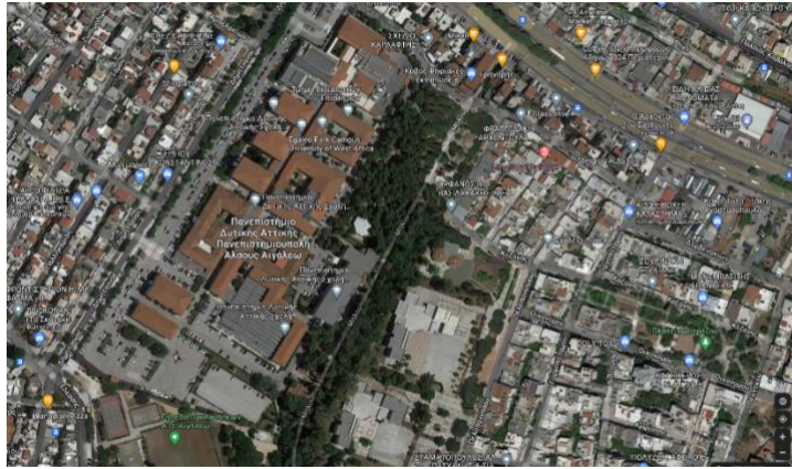
Πανεπιστημιούπολη «Άλσους Αιγάλεω», Αγίου Σπυρίδωνος, 12243 Αιγάλεω